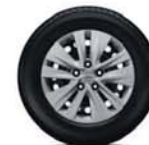
16"-stalen wielen met wioldoppen