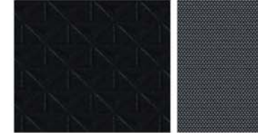
N-CONNECTA & N-DESIGN STANDAARD Zwarte stof / Zwart stof