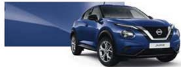
Ink Blue (M) - RBN