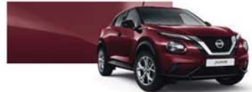
Burgundy (M) - NBQ