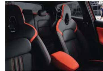
N-DESIGN OPTIONEEL - ACTIVE ORANGE Gedeeltelijk zwart leder met oranje inzetstukken