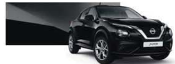
Enigma Black (M) - Z11