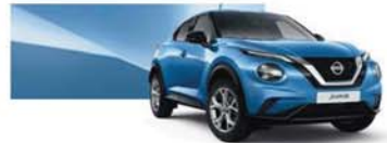
Vivid Blue (M) - RCA