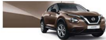
Chestnut Bronze (M) - CAN