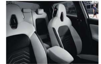
N-DESIGN OPTIONEEL - LIFESTYLE WHITE Zwart textiel met reliëf met PVC-inzetstukken