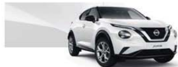
Solid White (S) - 326