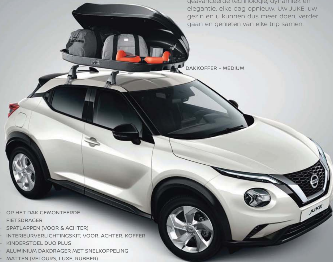
DAKKOFFER - MEDIUM

Net zoals uw JUKE, is het aanbod van accessoires ontworpen met het oog op geavanceerde technologie, dynamiek en elegantie, elke dag opnieuw. Uw JUKE, uw gezin en u kunnen dus meer doen, verder gaan en genieten van elke trip samen.