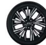
19" lichtmetalen velg