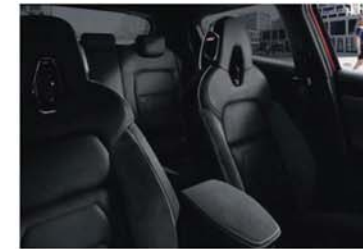
N-DESIGN OPTIONEEL - CHIC BLACK Gedeeltelijk zwart leder met zwarte inzetstukken