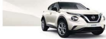
Pearl White (P) - QAB