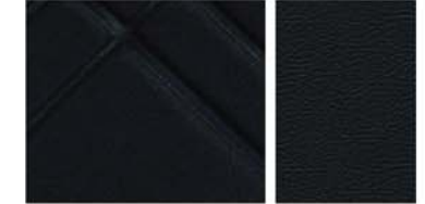
TEKNA STANDAARD Zwart textiel reliëf / Zwart textiel