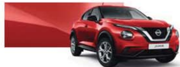
Solid Red (S) - Z10