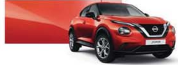
Fuji Sunset Red (M) - NBV