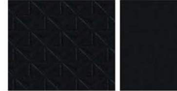
ACENTA & VISIA STANDAARD Zwarte stof / Zwart stof