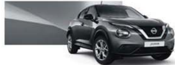
Gunmetal Grey (M) - KAD