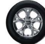
17" lichtmetalen velg