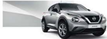
Platinum Silver (M) - KYO