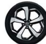
19" lichtmetalen velg